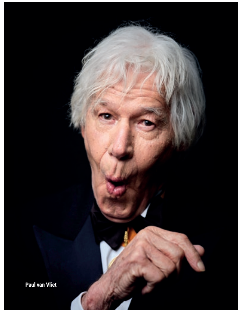
Paul van Vliet